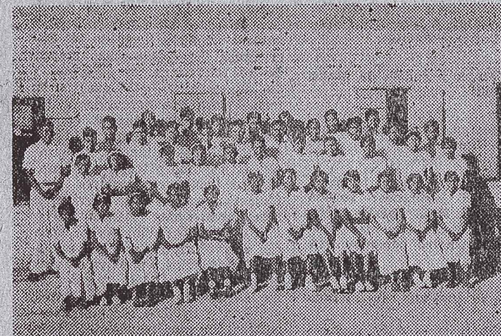
PARAGUAY. — Por la gracia de Dios, muchos indios paganos de las selvas del Paraguay se han convertido al Señor.

El Chaco de Paraguay a menudo ha sido llamado "El Infierno Verde". Hoy en día hay "fuentes de aguas vivas" en estos llanos, porque aquí el Evangelio ha transformado indios salvajes de las tribus Lengua y Chulupí en creyentes fieles. Ahora hay varias iglesias organizadas con más de 800 creyentes bautizados! Esto es un milagro de Dios y sólo puede adaptarse a las palabras del Salmo 118:23: "De parte de Jehová es esto, y es cosa maravillosa a nuestros ojos."